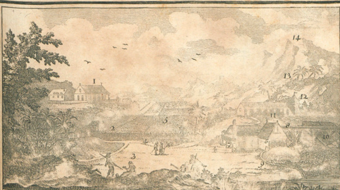
Moulin A Sucre