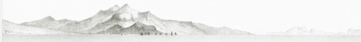
La Basse-Terre à 9 milles (Guadeloupe)