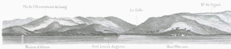
Entrée du port de Christianstad