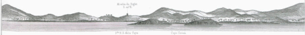
Alignement pour atteindre le mouillage de la Caye Green.