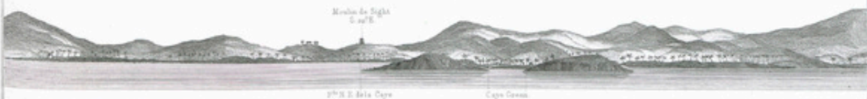
Alignement pour atteindre le mouillage de la Caye Green.