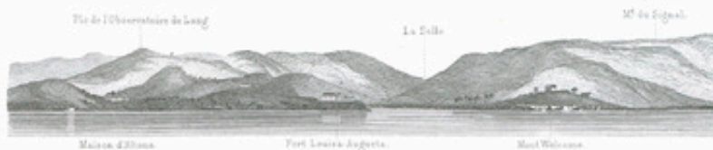
Entrée du port de Christianstad