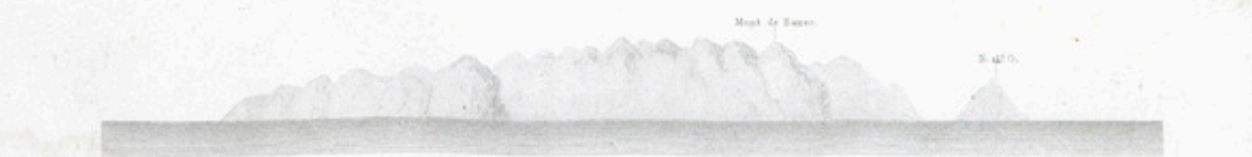
Montagnes du Saint-Espirit, situées dans le N. E. de La Trinité.

Dessiné par L. L. L. d'après les cartes des cartes navales et les données de M. L. L.