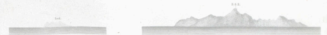
Pic de Tarquinio à 70 milles.