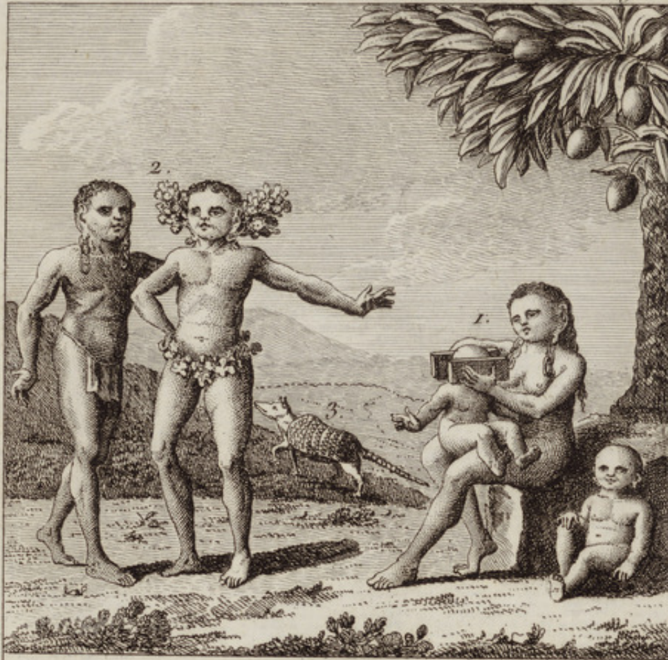
L'ante, appelle' la grande Bête.