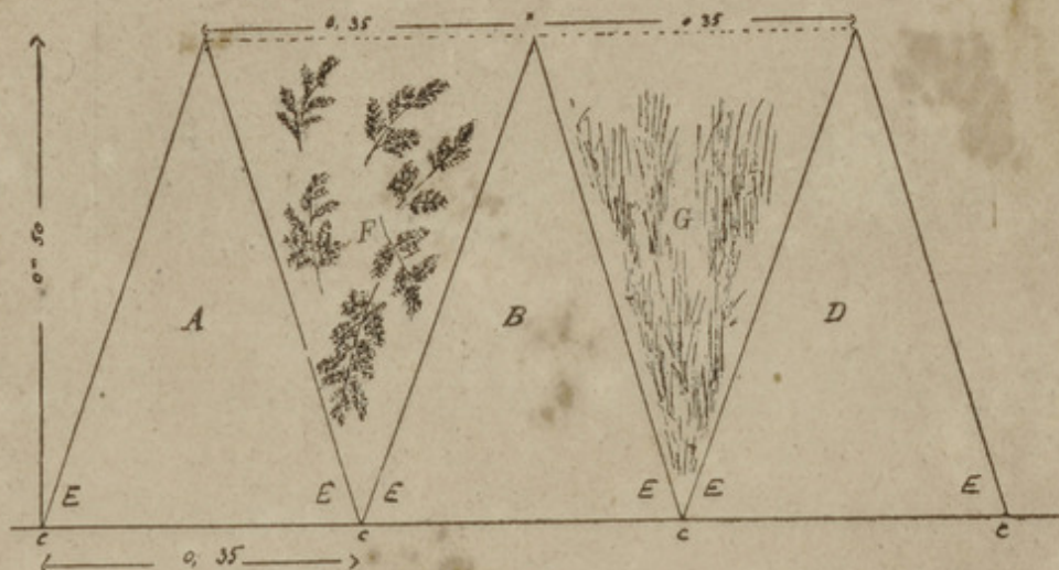
Croquis schématique de la disposition des claies coconnières sur les claies d'éducation.

T T Traverses sur lesquelles sont fixés les bambous B B.