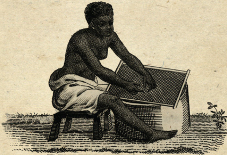
Passeuse de Farine de Manioc.